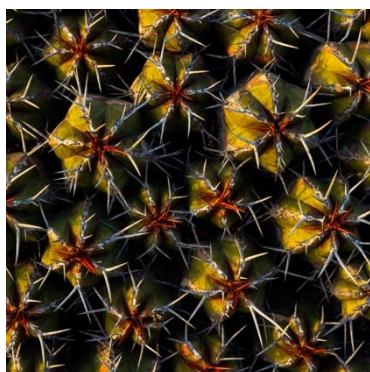
Euphorbia officinarum echinus